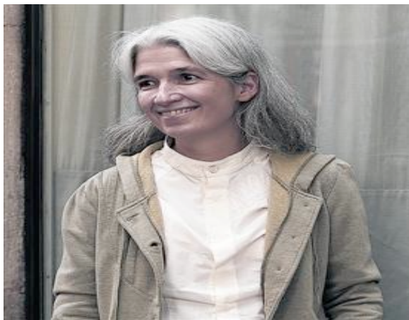
Belén Gopegui, durante la presentación del libro en Barcelona.